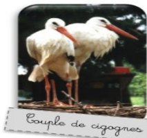
Couple de cigognes