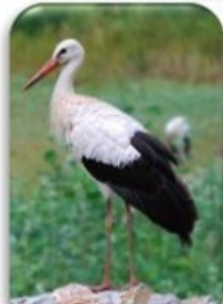
C'est un oiseau échassier.