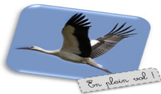
En plein vol !